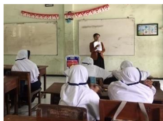
Gambar 2. Peneliti Menyampaikan Cara Pengisian LKK

Tahap kedua yaitu merencanakan penyelidikan, peneliti menyampaikan cara pengisian Lembar Kerja Kelompok (LKK) dan tentang apa saja yang harus mereka lakukan dalam kelompok untuk menyelesaikan permasalahan LKK tersebut. Gambar 2 di bawah ini menunjukkan bagaimana peneliti menyampaikan cara pengisian LKK.