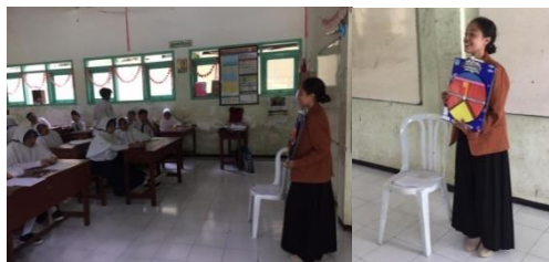
Gambar 1. Penyampaian Materi Menggunakan Media suling

kepada siswa, lalu mengorganisir siswa dalam kelompok yang beranggotakan 5-6 anggota tiap kelompok, dengan kemampuan yang berbeda-beda. Siswa yang bekerja dalam kelompok, didorong untuk bekerjasama dan berkoordinasi untuk menyelesaikan tugas tersebut.