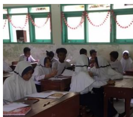
Gambar 5. Siswa Mempresentasikan Hasil Diskusinya

Pada tahap kelima yaitu menyajikan laporan akhir. Pada kegiatan ini setiap kelompok menyajikan hasil pekerjaan mereka di depan kelas, dan siswa dari kelompok lain diwajibkan memberi komentar, menanggapi, ataupun menyanggah hasil presentasi yang dibawakan. Peneliti juga menambahkan konsep yang kurang saat siswa presentasi dan menyempurnakannya agar siswa lebih mengerti. Gambar 5 di bawah ini menunjukkan siswa mempresentasikan hasil diskusinya di depan kelas.