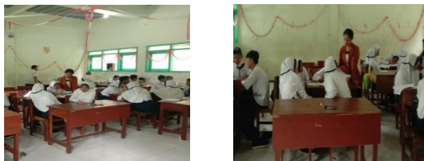
Gambar 3. Peneliti Membimbing Kelompok yang Mengalami Kesulitan Dalam Pengerjaan LKK

Pada tahap keempat yaitu menyiapkan laporan akhir, peneliti meminta masing-masing siswa menguasai materi dan jawaban hasil diskusi mereka agar bisa mempertanggungjawabkannya saat presentasi kelompok. Peneliti juga membimbing siswa merencanakan seperti apa presentasi yang akan mereka bawakan dan membentuk panitia presentasi, seperti ketua kelompok, notulis dan moderator dengan anggota kelompok yang lain tetap membantu tugas panitia presentasi. Gambar 4 di bawah ini menunjukkan siswa membentuk panitia untuk melakukan presentasi.