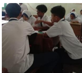
Gambar 4. Siswa Membentuk Panitia Presentasi

Pada tahap keempat yaitu menyiapkan laporan akhir, peneliti meminta masing-masing siswa menguasai materi dan jawaban hasil diskusi mereka agar bisa mempertanggungjawabkannya saat presentasi kelompok. Peneliti juga membimbing siswa merencanakan seperti apa presentasi yang akan mereka bawakan dan membentuk panitia presentasi, seperti ketua kelompok, notulis dan moderator dengan anggota kelompok yang lain tetap membantu tugas panitia presentasi. Gambar 4 di bawah ini menunjukkan siswa membentuk panitia untuk melakukan presentasi.